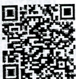
ลงทะเบียนเข้าร่วมโครงการ