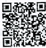
คุณสมบัติใหม่เงื่อนไข