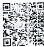
สแกนคิวอาร์โค้ด

สแกนคิวอาร์โค้ด (QR CODE) เพื่อลงทะเบียนเข้าร่วมโครงการ หรือติดต่อสำนักงานจัดหางานจังหวัดกาญจนบุรี โทร.034-564315 ต่อ 106 หรือ Line ID : @ykw9595w (สำหรับนายจ้าง) ID : @amy7134q (สำหรับผู้จบการศึกษาใหม่)